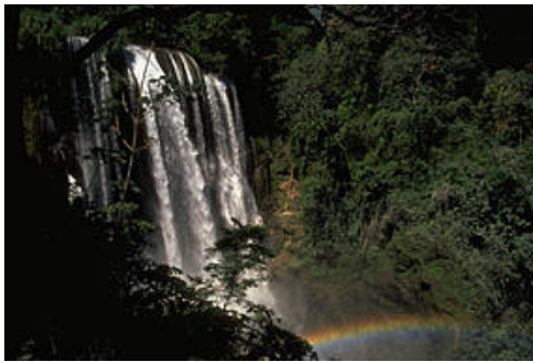
HON-0007 LAGO DE YOJOA