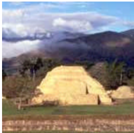
HON-0004 EL PUENTE